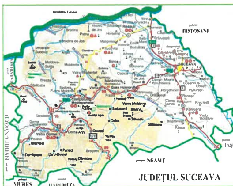
Harta Județului Suceava

Strategia de Dezvoltare a județului Suceava este prezentată doar pentru perioada 2011– 2020, (cea pentru perioada 2021-2027 se află în faza de elaborare, se estimează a fi finalizată în decembrie 2021, va continua obiectivele și măsurile propuse perioadei anterioare), și își propune să canalizeze forțele care acționează la nivelul comunităților locale, pentru realizarea unui deziderat comun reprezentat de progresul ferm în dezvoltarea județului, corelat cu strategiile sectoriale, regionale, naționale și europene.