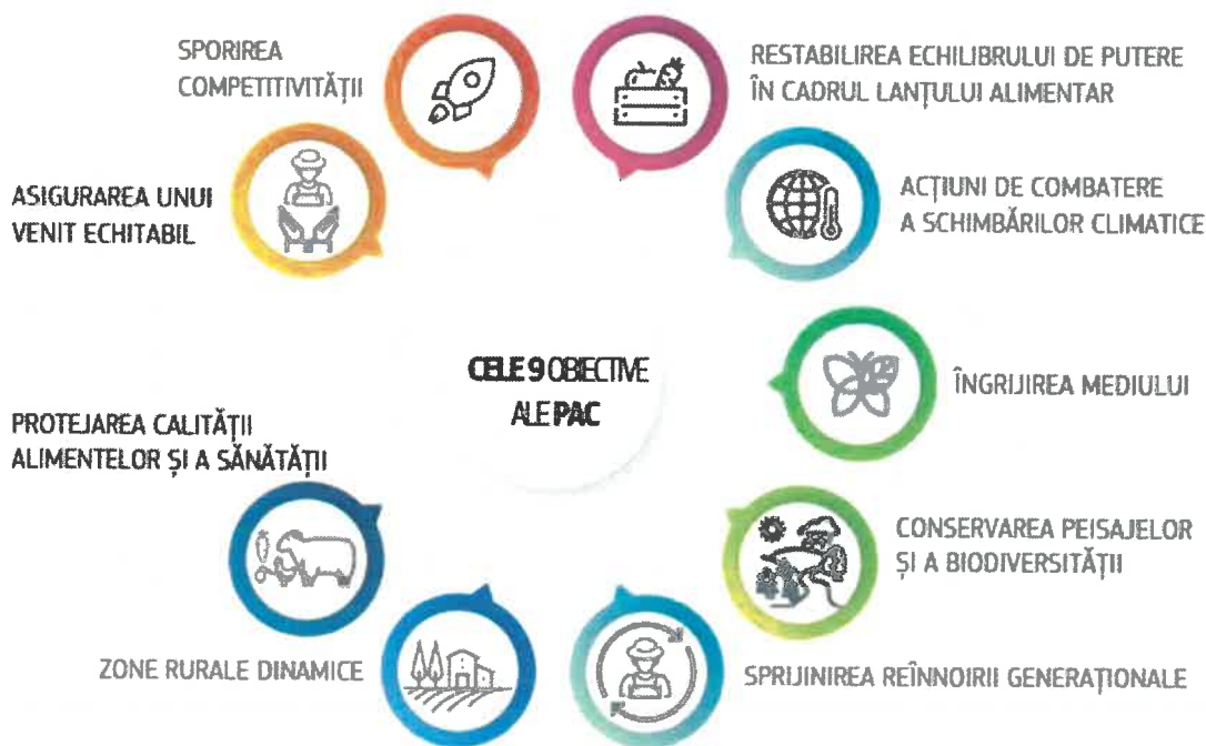
Figura nr. 4 – Obiectivele Politicii Agricole Comune