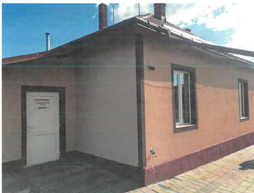
Dispensar medical Bălăceana