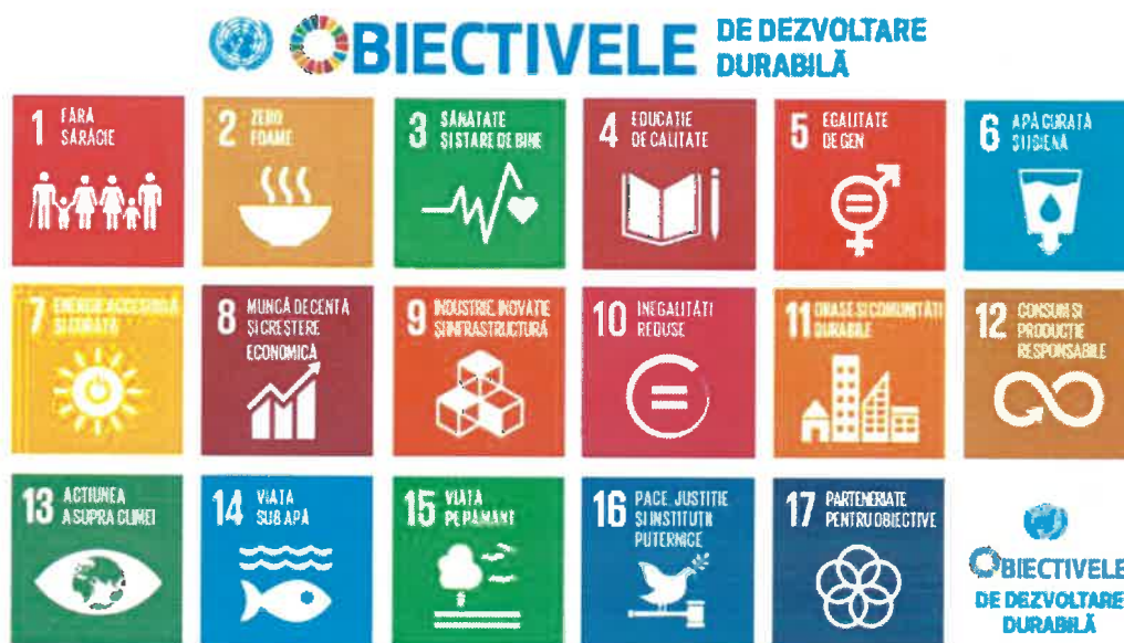
Figura nr. 2 – Obiectivele de dezvoltare durabilă 2030

Strategia reprezintă modalitatea de conectare practică, de articulare a României la parteneriatele naționale, regionale, europene și globale specifice. Totodată, ca efect al participării voluntare a României la raportările periodice cu privire la stadiul implementării Agendei 2030, Strategia contribuie la creșterea credibilității, eficacității și impactului politicilor implementate.