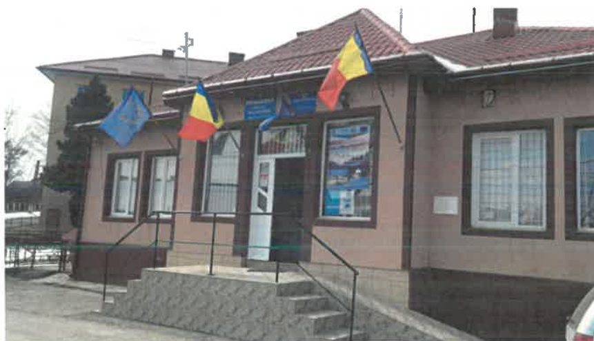
Sediul Primăriei și al Consiliului Local

Autonomia locală se exercită de către autoritățile administrației publice locale de la nivelul comunei. Acestea sunt consiliile locale, ca autorități deliberative, și primarii, ca autorități executive.