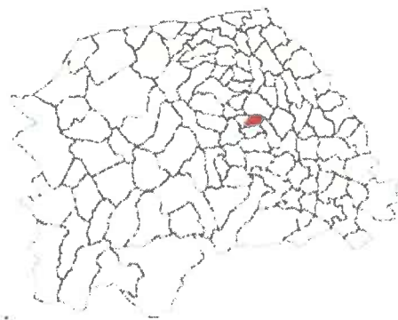
Poziționare geografică – comuna Bălăceana, județul Suceava

Cea mai apropiată așezare urbană este Cajvana, oraș situat la 15 km urmat de orașele Gura Humorului și Solca, aflate la o distanță de 23 km.