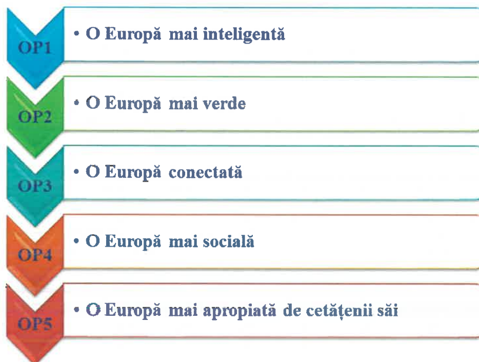
Figura nr. 1 – Priorități de investiții 2021-2027

Politica de coeziune continuă investițiile în toate regiunile, pe baza a 3 categorii (mai puțin dezvoltate, în tranziție, mai dezvoltate). Metoda de alocare a fondurilor se bazează încă, în mare măsură, pe PIB-ul pe cap de locuitor. Se introduc noi criterii (șomajul în rândul tinerilor, nivel scăzut de educație, schimbări climatice și primirea și integrarea migranților), pentru a reflecta mai bine realitatea de pe teren. Regiunile ultraperiferice vor beneficia în continuare de sprijin special de la UE. Politica de coeziune continuă să sprijine strategiile de dezvoltare conduse la nivel local și să autonomizeze gestionarea fondurilor de către autoritățile locale. Crește și dimensiunea urbană a politicii de coeziune, prin alocarea a 6 % din FEDR dezvoltării urbane durabile și printr-un nou program de colaborare în rețea și de consolidare a capacităților dedicat autorităților urbane, sub denumirea Inițiativa urbană europeană.